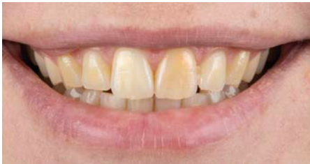
Voor Boutique Whitening