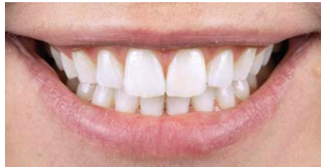
Na Boutique Whitening