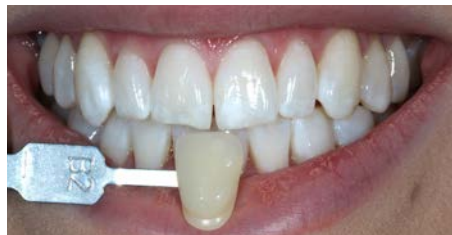
Na Boutique Whitening