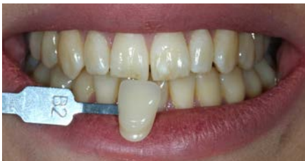
Voor Boutique Whitening